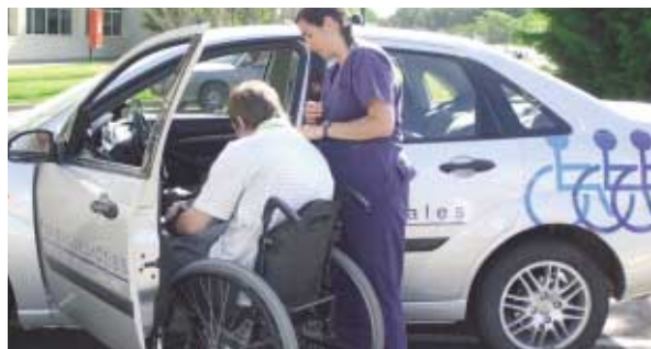
• Ford Focus, compartido entre FLENI y el ACA.

A nuestro instituto llegan muchos pacientes con 17 y 18 años con alguna discapacidad de nacimiento que quieren manejar por primera vez, pero también llegan pacientes que ya manejaban. Lo primero que hay que transmitirles es que no existen en el mundo dos personas con idéntica discapacidad. Por eso, a cada una de ellas se la debe considerar única y tener en cuenta esto a la hora de analizar los avances y los requerimientos de conducción vehicular. Hay que contemplar las características propias de cada conductor con discapacidad al momento de comprar un auto especialmente adaptado para su manejo. La persona no tiene que adaptarse al vehículo, sino que el vehículo debe adaptarse a la persona.